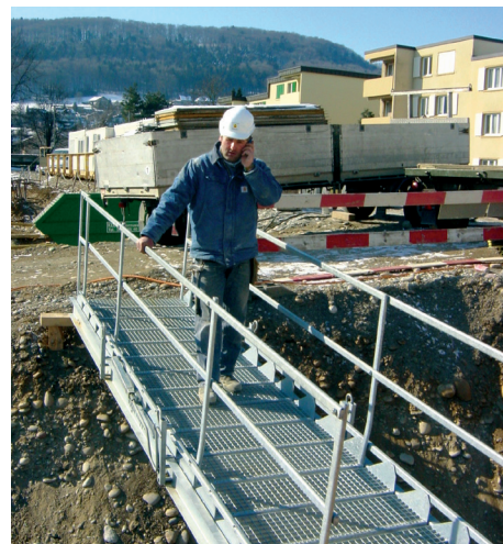
Sichere Baustellenbrücke mit integriertem Geländer