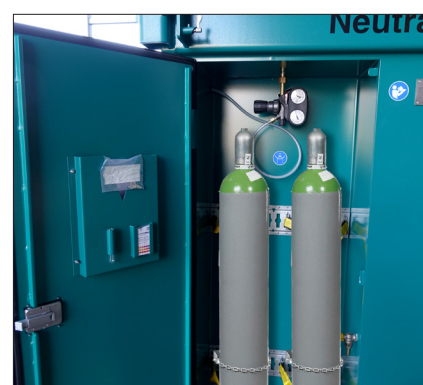
Integrierter Schrank für CO2-Druckgasflasche