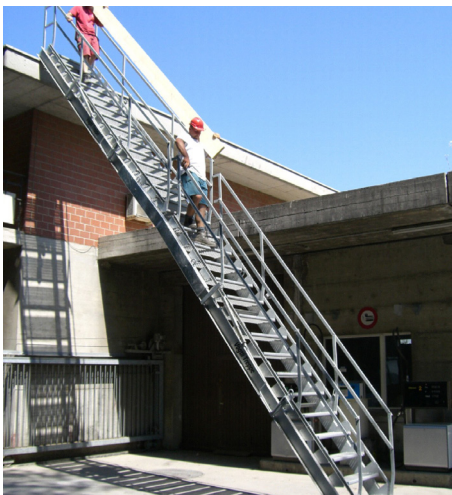
Treppen mit Treppenverbinder