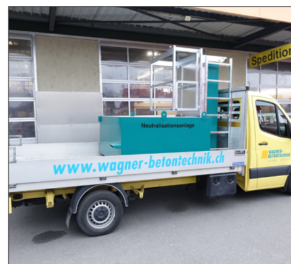
Einfacher Transport mit Lieferwagen

Die Waschstation mit einem Volumen von 1500 lt. dient zur Reinigung von mit Beton verschmutzten Gerätschaften. Sie überzeugt durch ihre sehr kompakte und ausgeklügelte Bauweise und dies unter Einhaltung hoher Sicherheitsbestimmungen. Die äusserst einfache Handhabung ermöglicht die Betriebsbereitschaft innert kürzester Zeit und erleichtert das Umsetzen von Massnahmen zum Schutz der Umwelt.