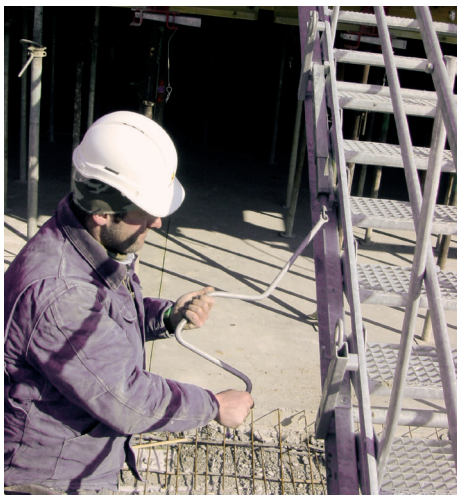
Jede Neigung mit Kurbel einfach einstellbar